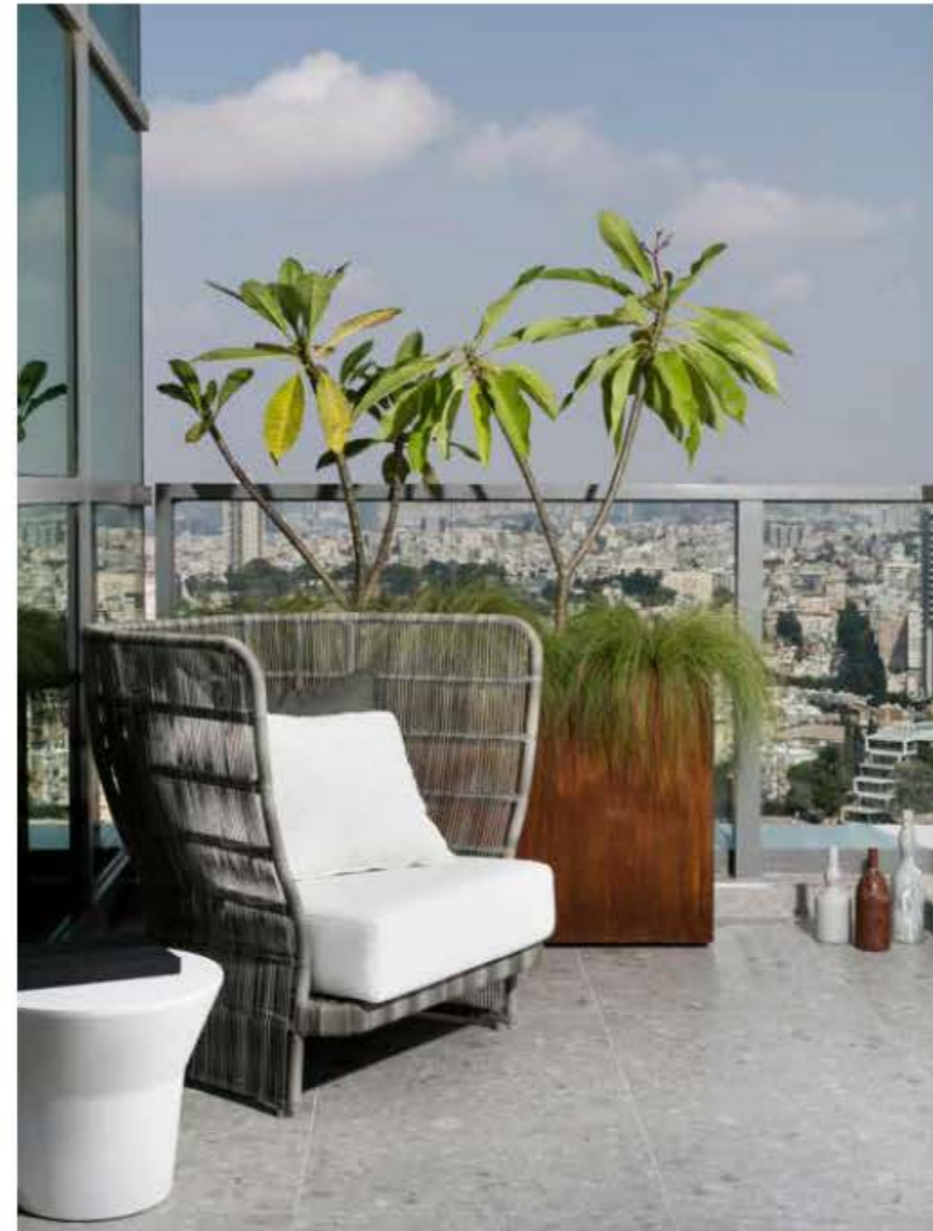
MAXALTO 出品的 FEBO 系列扶手椅

阳台的植物角经过精心布置：花盆里的植物投影在玻璃上，装饰着玻璃幕墙。旁边的小阳台弥漫着自然的气息。厨房的大理石地面一直延伸到浴室和主卧旁。阳台上的芦苇编扶手椅舒适透气，纵向条纹图案与玻璃幕墙相呼应。扶手椅旁，盆栽植物放肆生长，搭配旁边的森林系装饰花瓶，将自然元素引入阳台空间。