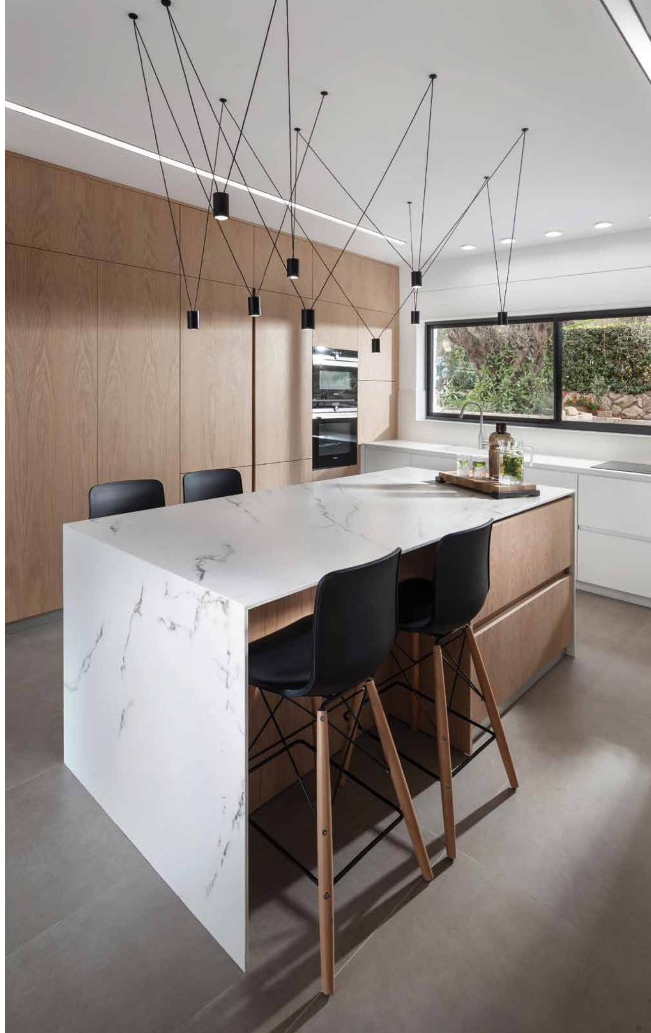
תאורה: קבסו תאורה, מטבח: סמל, משטחים: דקטון