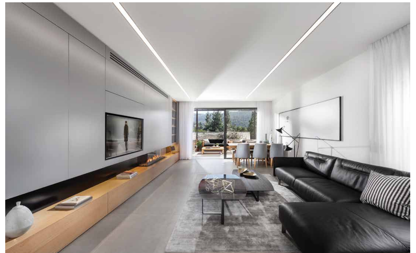
ארונות: אידיאל, שטיחים: איתמר שטיחים, ספה: נטוצי, כיסאות: ART - גלריה לרהוט, פינת אוכל: ZAGA

לכאורה, נראה היה כמובן מאליו שבאזור עם נוף של עצי יער והרים, הבית במושב חייב לשאת אופי כפרי, אך למעשה, במיוחד לאור העובדה שזוג הדיירים ביקשו לעצמם בית עכשווי מאוד אבל שיהיה גם חמים ונעים, הצליח ארז חייט להוכיח שגם עיצוב מודרני יכול להשתלב בנוף כפרי