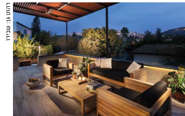
הזוט גז: שבירז

ל"חימום" האווירה בבית, בין גוני האפור, לבן ושחור הוא שילוב גוונים טבעיים של עץ בסלון, במטבח ובשירותים, למעט חדר השינה של הזוג, בו החמימות מיושמת בקימורים הנמשכים לאורך כל הקיר ובתוספות טקסטיל