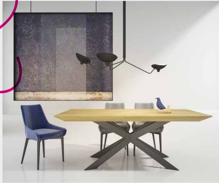
פינת האוכל במרכז

לקבלת מראה קליל, אקלקטי ומודרני, צרפו לשולחן האוכל כיסאות בעלי גווני מיוחדים העשויים מחומרים שונים כגון: פלסטיק, בד, או הדבר הבא-כיסאות מקטיפה. ZAGA