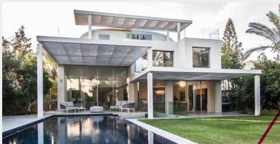
החיבור בין גודל ומינימליזם

עיצוב עונתי שומר על עדכון וריענון תמידי. החורף מדגיש את השימוש בגווני החמים והעמוקים, די בספה איכותית ומקבץ כריות אופנתיות, כדי להעניק מראה מחודש ועשיר לחלל כולו. NATUZZI