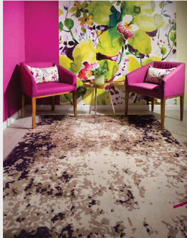
משתלבים עם השטיח

לקבלת מראה קליל, אקלקטי ומודרני, צרפו לשולחן האוכל כיסאות בעלי גווני מיוחדים העשויים מחומרים שונים כגון: פלסטיק, בד, או הדבר הבא-כיסאות מקטיפה. ZAGA