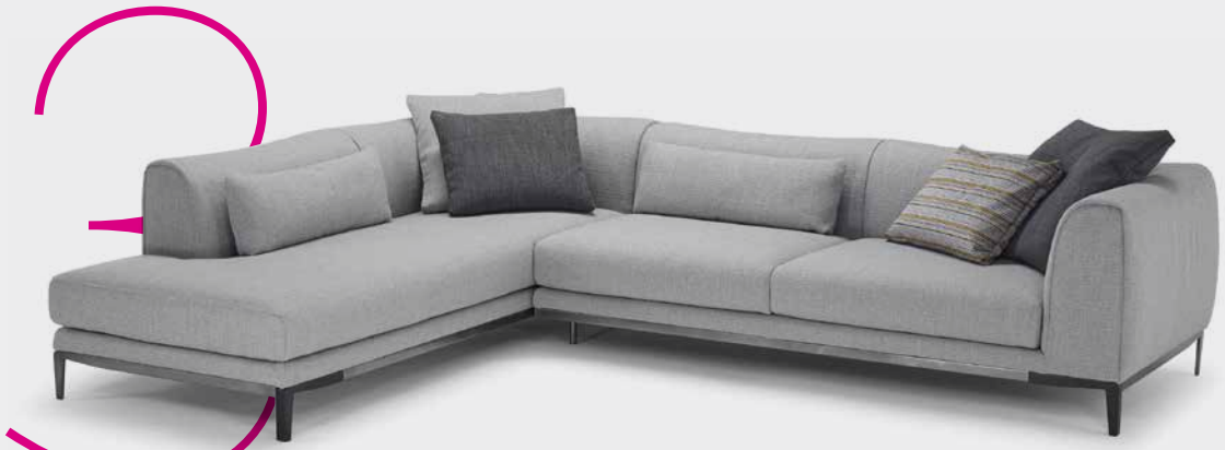
סטייל בניד כרית

במקרים בהם בוחרים שטיח חדש לסלון מרוהט חשוב לקחת בחשבון שילוב נכון של כל הצבעים הנמצאים בחלל. תמיד ניתן להיעזר באמנות, כריות או חפצי נוי כדי לייצר הרמוניה משותפת בין הקירות לריהוט. השטיח יכול בהחלט להיות הגורם המאחד את כל הצבעוניות בחלל. איתמר שטיחים